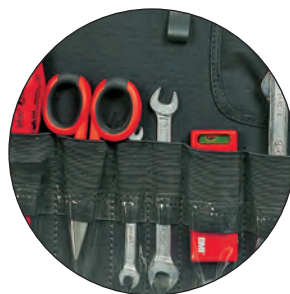
Tasche in materiale elastico con parte inferiore trasparente

Con 2 pannelli in ABS con fissaggio degli utensili tramite resistenti tasche in materiale elastico , facilmente adattabili alle dimensioni dell'oggetto, che non fuoriesce anche in caso di capovolgimento della valigia La parte inferiore della tasca è inoltre in materiale plastico trasparente per una facile individuazione dell'utensile Ampio fondo con divisori rimovibili Maniglia maggiorata ed ergonomica Con 2 serrature con chiave Dimensioni LxPxh 455x330x195 mm - Peso 4,7 kg