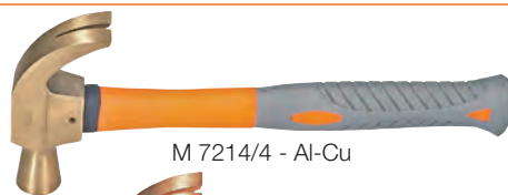
M 7214/4 - Al-Cu