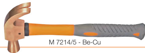
M 7214/5 - Be-Cu

Tipo con battente quadro e penna simmetrica