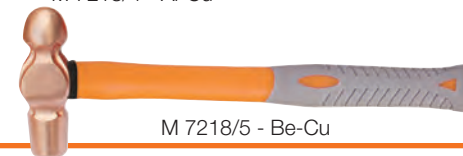
M 7218/5 - Be-Cu