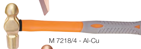
M 7218/4 - Al-Cu