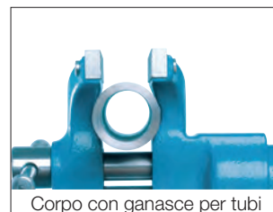
Corpo con ganasce per tubi