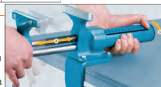
Quicklaunch: per apertura rapida senza leva di manovra