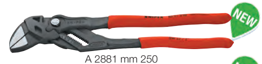
A 2881 mm 250