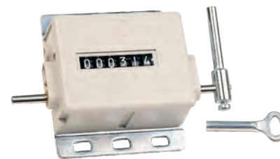
A 6 cifre