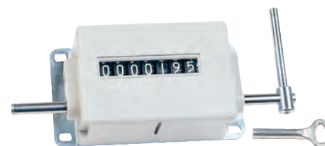
A 7 cifre