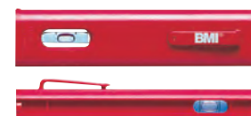
Impiego con filo a piombo