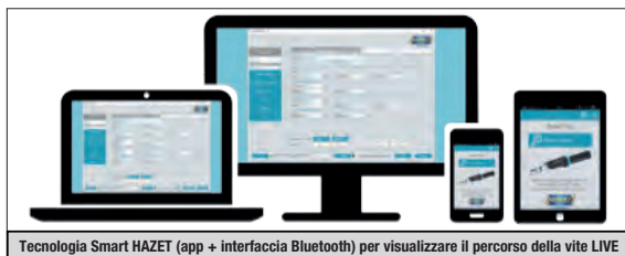
Tecnologia Smart HAZET (app + interfaccia Bluetooth) per visualizzare il percorso della vite LIVE