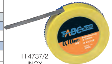
H 4737/2 INOX

Impugnatura per spessimetri a nastro, in acciaio temperato