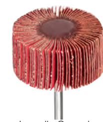
Lamelle Ceramic: elevata asportazione, autoriaffilante, maggiore aggressività e durata