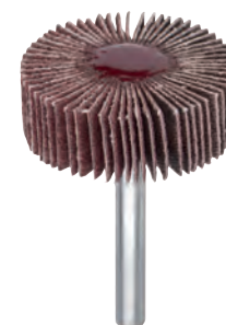
Al corindone con legante abrasivo per acciaio INOX

Al corindone per impiego frontale e laterale