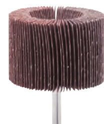
Esecuzione per impiego frontale e laterale

Esecuzione ceramicata - Velocità di rotazione max. 12700 giri/min