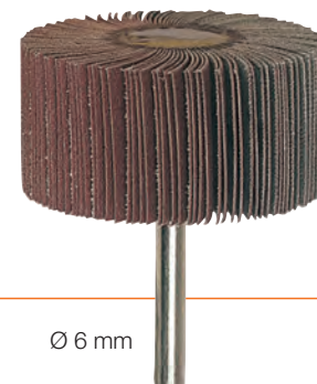
Ø 6 mm