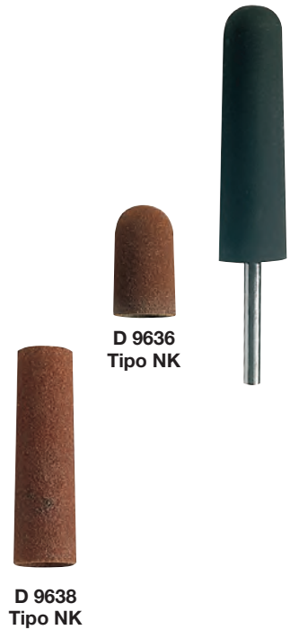
D 9636 Tipo NK