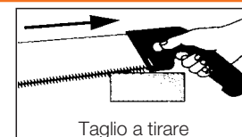
Taglio a tirare