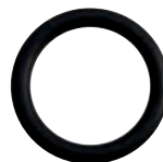
A 3223/82 e A 3223/83