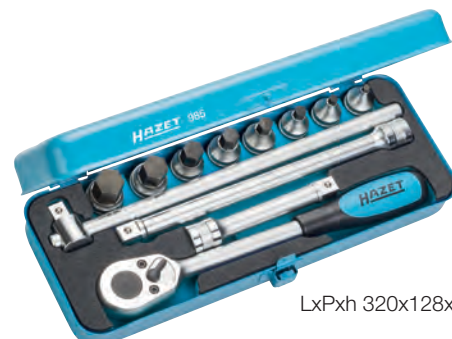
LxPxh 320x128x58 mm