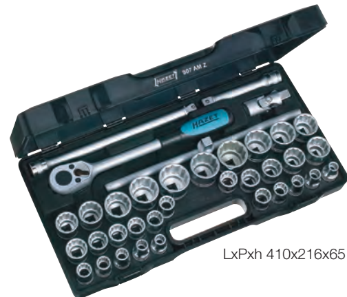
LxPxh 410x216x65 mm